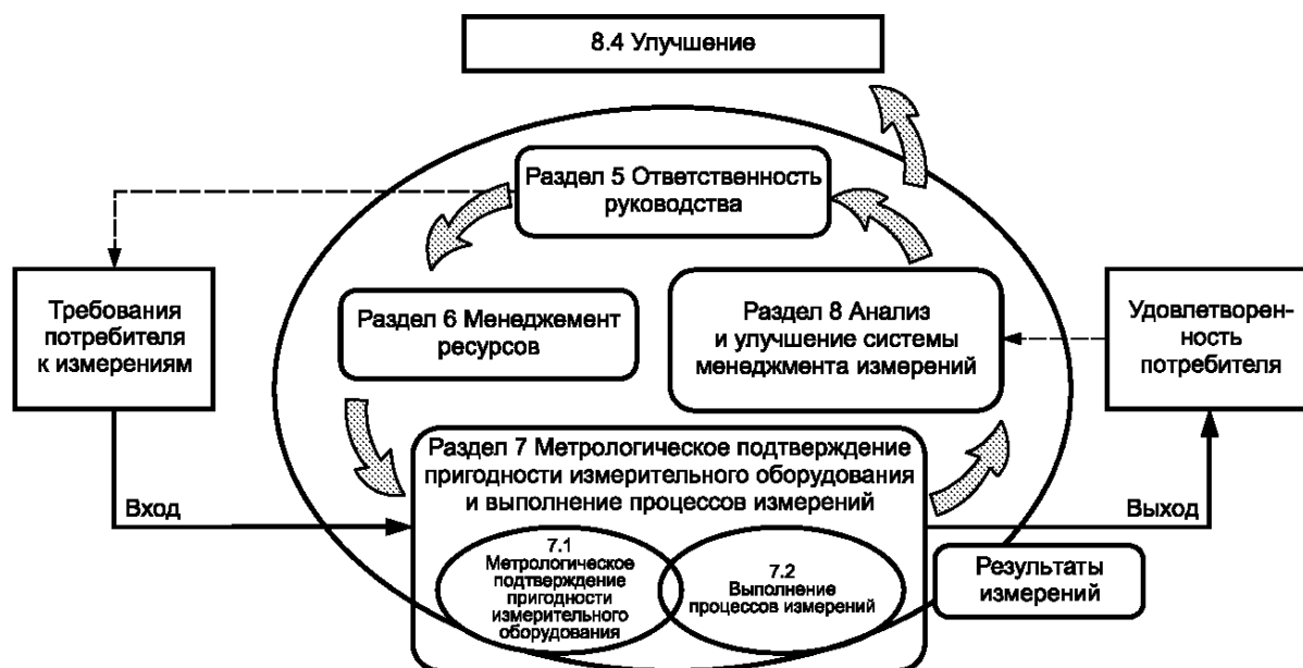
Рисунок 1 — Модель системы менеджмента измерений

Одним из установленных принципов менеджмента качества в ИСО серии 9000 является процессный подход. В системе менеджмента измерений процессы измерений следует рассматривать как специальные процессы, направленные на обеспечение требуемого качества продукции, выпускаемой организацией. Модель системы менеджмента измерений, соответствующая настоящему стандарту, представлена на рисунке 1.